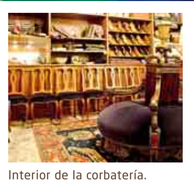
Interior de la corbatería.